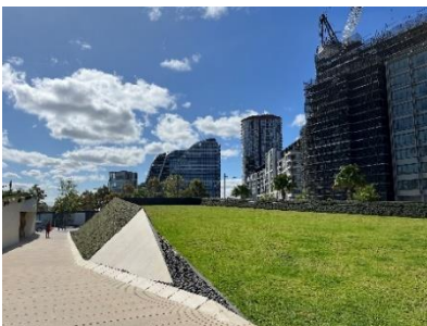
折り紙をモチーフにした立体的な地形

公園の敷地はもともと広大な湿地帯でしたが、経済の発展とともに埋め立てられ羊毛産業の土地として利用されてきました。水循環のサイクルは以前の湿地帯の自然環境を再現しており、シドニー市や Green Square の生態系回復を象徴しています。