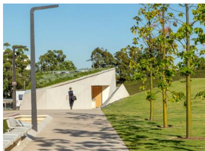
バリアフリーな園路