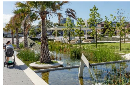
水が循環する水路