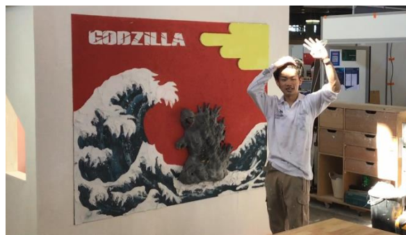
完成した作品の前で記念撮影

《お問い合わせ先》 住友林業株式会社 コーポレート・コミュニケーション部 内田・平川 TEL:03-3214-2270