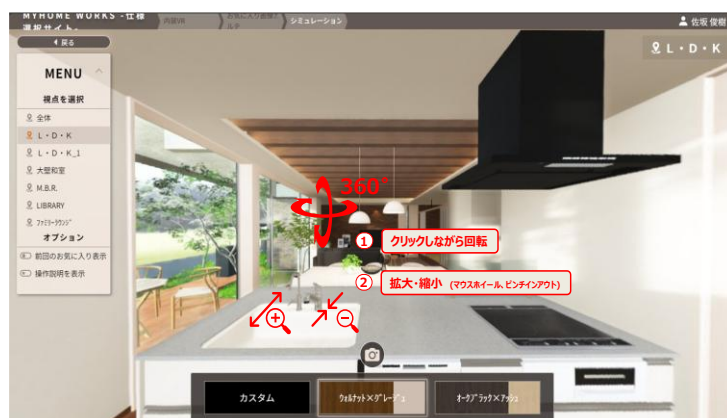
「MYHOME WORKS」内 内装 VR サイト