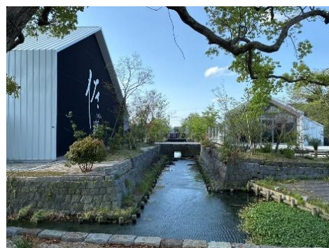
冷蔵貯蔵庫前の水路