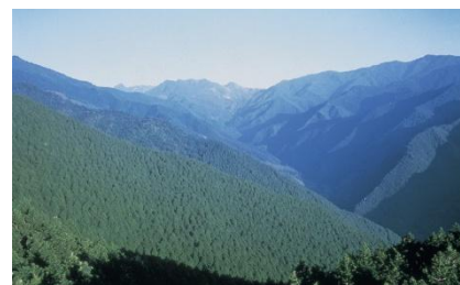
住友林業の四国社有林

佐嘉酒造は元禄元年(1688)創業の、佐賀県最古の酒蔵を起源とします。代表銘柄「窓乃梅」は長年、佐賀の地酒として地域の方々に親しまれてきました。