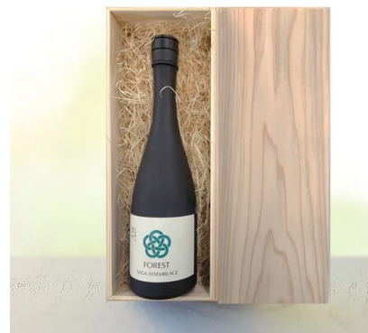
SAGA FOREST Bitter green と専用木箱