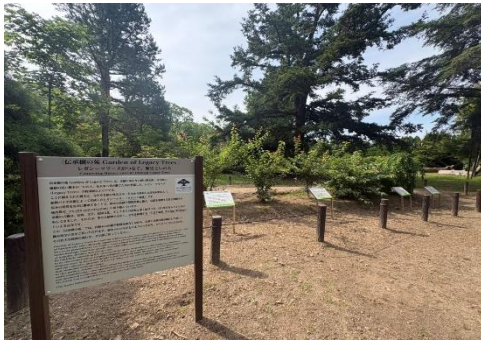
新エリア「伝承樹の苑」

「伝承樹の苑」の開設と京都府内の名木・貴重木のクローン増殖は、住友林業が参画する「京都府立植物園サポーター制度」に基づく取り組みの第一弾です。京都府立植物園と住友林業は本制度を通し、京都府内の名木・貴重木の保全と次世代への継承を推進していきます。