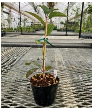
「かぎろひ」のクローン苗

二条城二の丸御殿白書院西側に位置する桜で、4本の現存が確認されています。京都の御所や離宮の庭園に広く植えられてきた代表的な品種です。2025年2月、現存する4本のうち1本の樹木から住友林業が組織培養による増殖に着手。2026年5月に苗木増殖に成功しました。