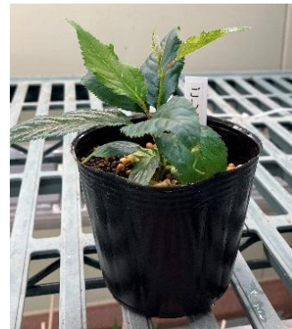
「御所御車返し」のクローン苗