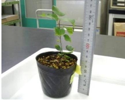
写真 5 温室内で育成した苗木