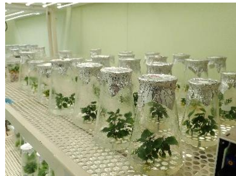
写真 2 多芽体からの芽の伸長 (培養 6 ヶ月目)