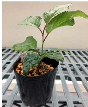
「譽桜」のクローン苗