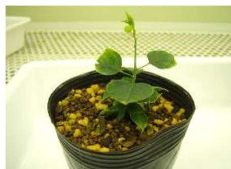
写真 4 一般の土壌で育成中の苗木