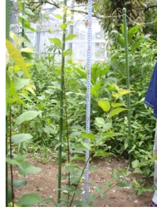
写真 6 畑で育成中の苗木