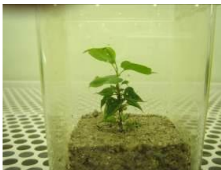
写真 3 人工土壌で発根した幼苗 (培養 8 ヶ月目)