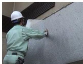
写真左) ベースシートの接着と座金付釘の打込み 写真右) 補強面にネットシートを施工