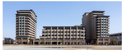
エレガーノ西宮 外観

本施設は、住友林業が培ってきた住まいや木と緑の効用に関する知見を活かしつつ、20年以上にわたる介護ノウハウに、充実した検診体制や多彩なプログラム等、健康寿命向上につながるサービスを追加しました。進化した「Elegano(エレガーノ)」ブランドとして高齢者の住まいを提供します。