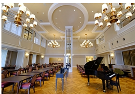
吹き抜けの「ダイニングルーム」