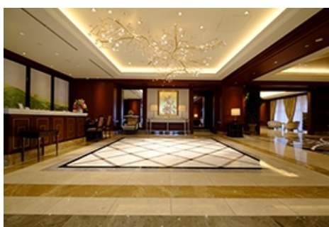
おもてなしの「エントランスホール」