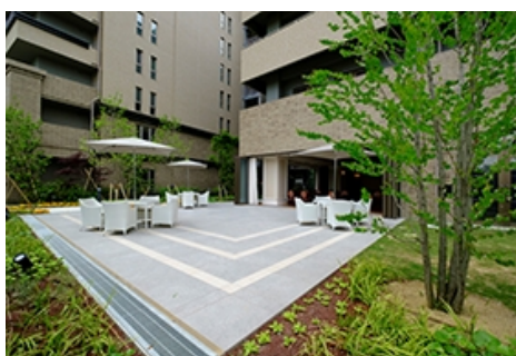
車いすの方でも気軽に緑を楽しめる「屋外テラス」 暮らしやすさを追求した一般居室(モデルルーム)