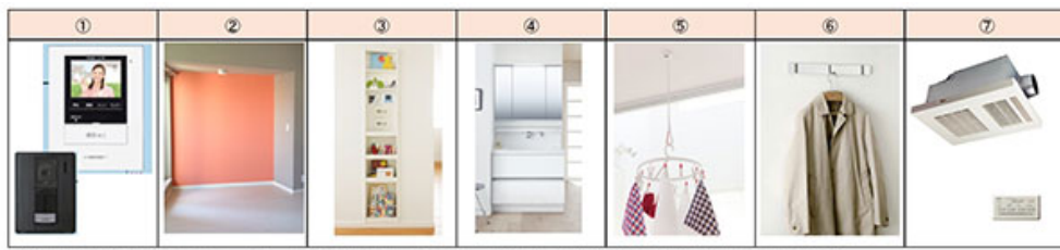
①録画機能付きインターホン ②アクセントクロス ③リビング壁埋込収納 ④洗面化粧台 ⑤室内物干し ⑥コートハンガー ⑦浴室乾燥暖房機