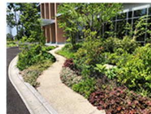
筑波研究所の新研究棟 住友林業緑化(株)が施工を担当